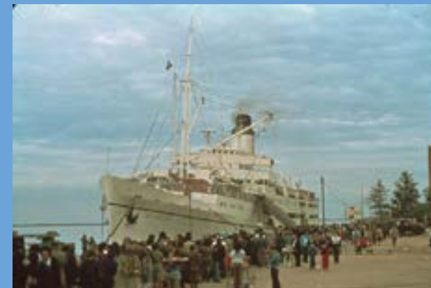
I løpet av sin tjeneste hadde MV Doulos verdensrekorden for det eldste sjøgående passasjerskipet – bygget i 1914, bare to år etter Titanic.