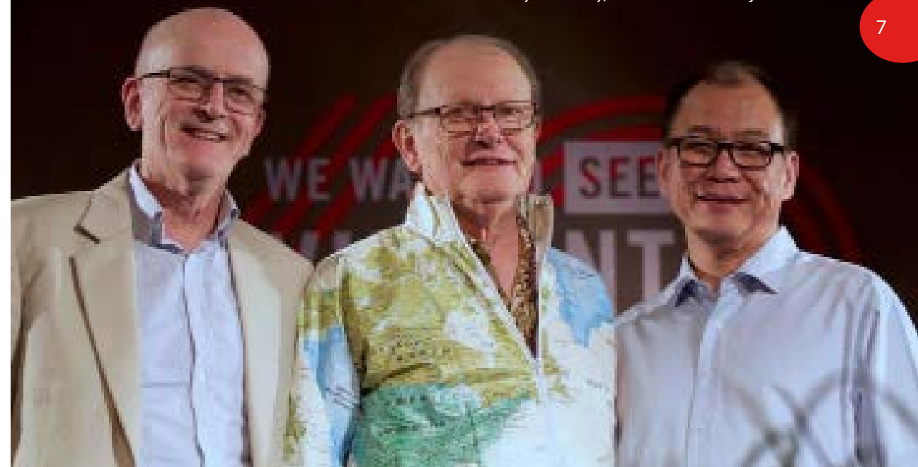
under OM's 60-årsjubileum i 2017