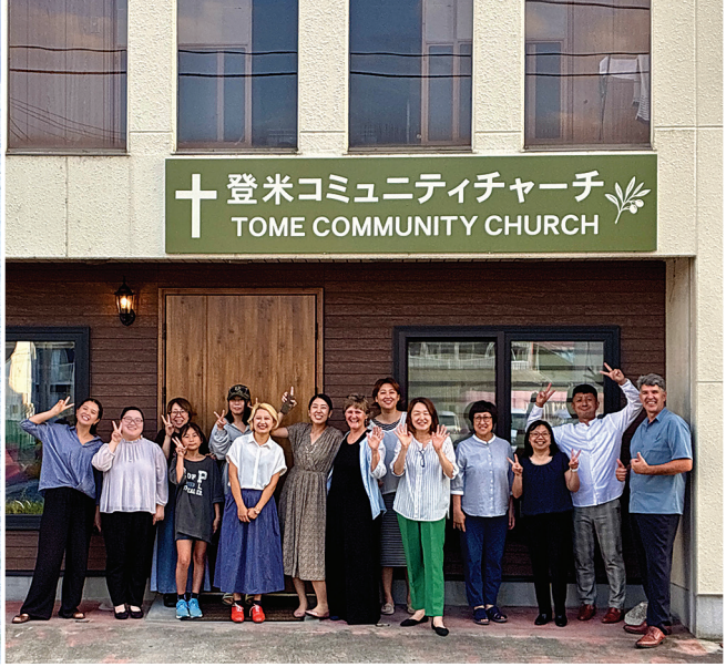
登米コミュニティチャーチ TOME COMMUNITY CHURCH

2011年の東日本大震災がきっかけで始まった宮城県登米市でのミニストリーは、人を教会に集めることではなく、信じた人々が自らの家で新しい教会を始められるように支援すること。