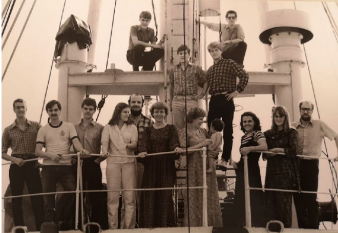
Norske og svenske OMere på Logos i 1981.

Jeg kommer hjem til jul, og over nyttår håper jeg å få jobb som styrmann, gjerne på Fjord1 el.l.»