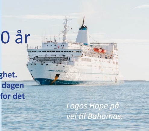
Logos Hope på vei til Bahamas.