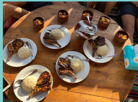
God, nordafrikansk mat var en del av opplevelsen.