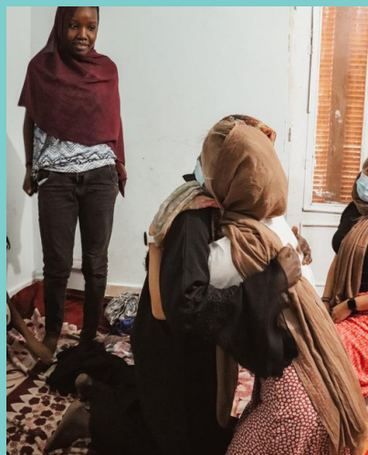
Sudanesiske flyktningebarn satte pris på omsorgen fra de norske studentene.