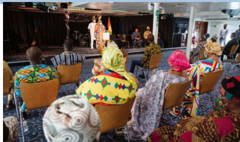
Flere nasjonale ledere besøkte Logos Hope under oppholdet i Ghana.

Fra januar til midten av mars har Logos Hope ligget til kai i Ghana. Der fikk det flerkulturelle mannskapet utrettet mye godt arbeid. De deltok bl.a. i strandrydding, utførte synstester og ga gratis briller til dem som trengte det, besøkte skoler og menigheter og holdt seminarer om bord.