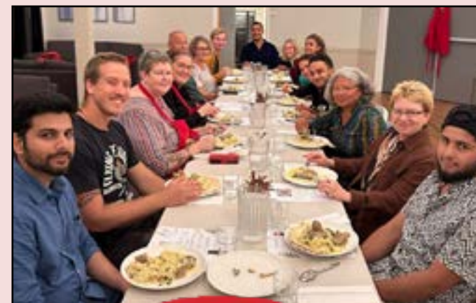
På "smak og vennskap"-samlingene får deltagerne lære forskjellige mat-tradisjoner og dele flerkulturelle opplevelser.

Samtidig merker vi et økende behov for et større samlingslokale. Nå har vi fått et tilbud om kjøp av et lokale på Tinnheia - se mer på s. 20.